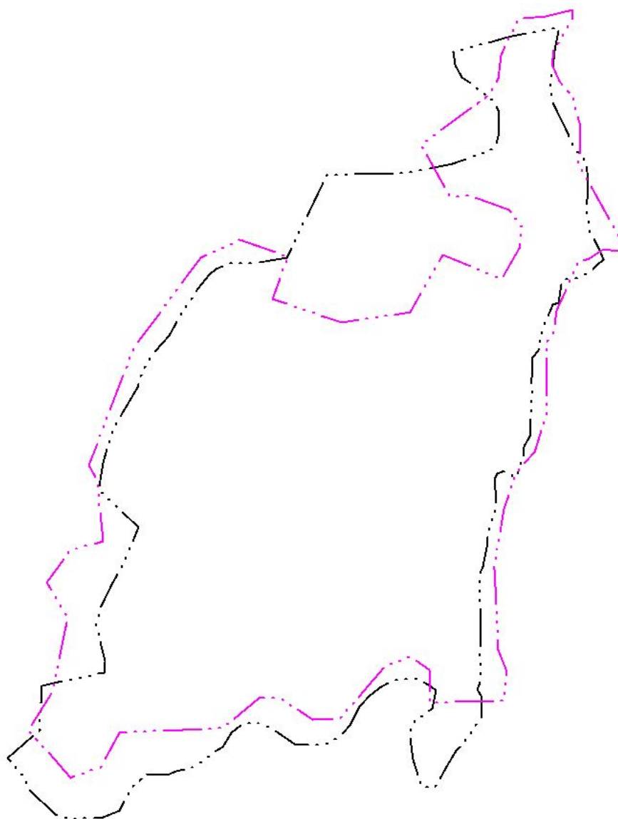
Рис. 2. Предложения по изменению границ п. Неготка